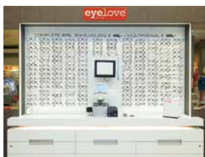
KEUZE UIT MEER DAN 175 MONTUREN!