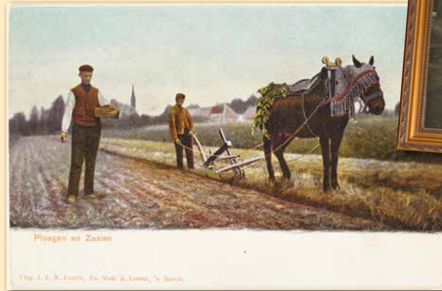
The J. A. S. Smith, De Velt & Looze, 's-Havert

Warandelaan 2 Tilburg University, Gebouw L 5037 AB Tilburg +31(0)13 - 466 2865 brabant@uvt.nl www.brabantcollectie.nl